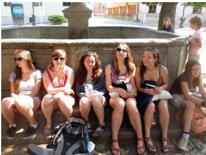
Dívčí výlet do Tábora