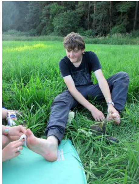
Ošetřování na honbě