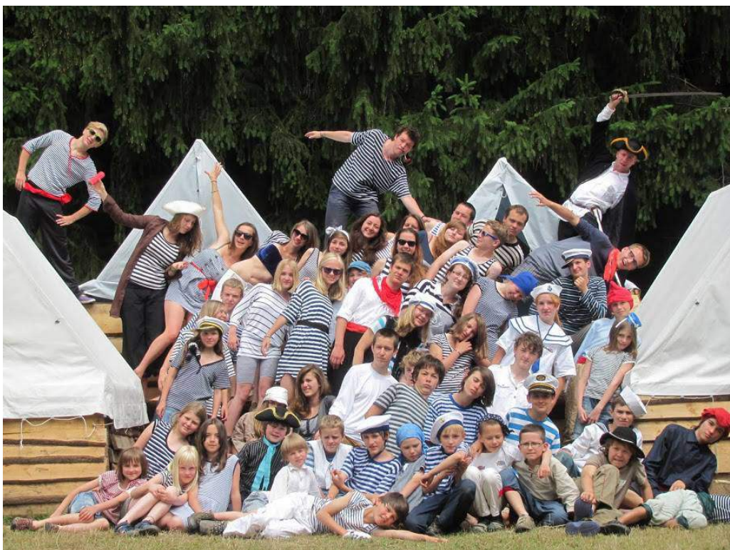
Skupinová fotografie v táborových oblecích

Poslední den jsme všechny požádali, aby zhodnotili uplynulé táborové dny a týdny prostřednictvím malé ankety