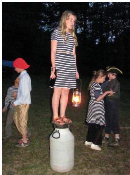
Party time u pirátů v Tortuze