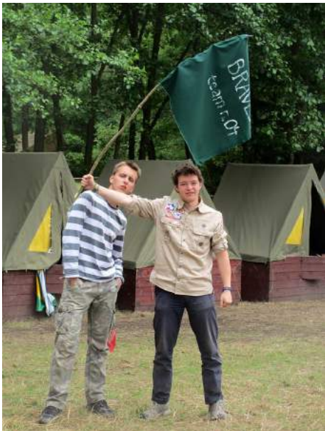
Capture the flag