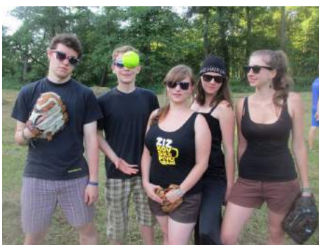
Team vajec při softovém utkání slepice x vejce