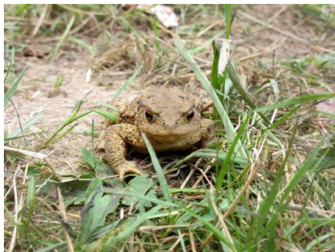
Žába sídlící pod stožárem

Spoustu dalších fotek si můžete prohlédnout na www.lumturo.cz