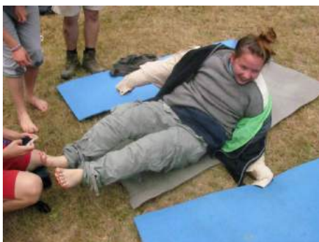
Návštěva u eskymáků