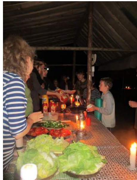
Táborový McDonald's po honbě